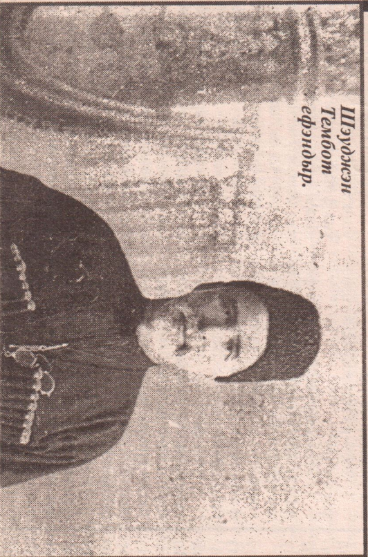
Шэхмэт Тэмбот эфэндывр.

Кыуаджэу Хыатыгыужыкыуае кыырыкыуатэм тыкыте мышц нахыбэмкля шыпсэурэ адыгэ лвэлкыэгыуэху клям шыгыэн фае, сыда зыплокля, лвэлкы тарихыым клям нафатыэ цаубыты. Тарихь тхыгыэхэр лэубытыпля тшы лвэлкыышхомэ ащыщыгыэху, ижыкля Шхыэгыуащэ, лүшыохэр япсэулыгыэху, я ХII-рэ лэшлэгыум кыычыкля щашлэху кыыхэтэгыщы. Гушылыу «клямгыем» имэхванэ «Клямыргыехэр» зылоу, пэсэрэ «Киммерийцэхэм» мь гыэху зылыгыэхэрэ тарихылыгыэхэм, «лвэлкы гушху»