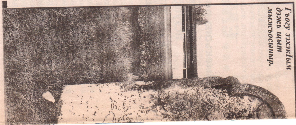
Гьоту ээхэлым дэжэ шыт мыжыосыныр.

Хыатыгыжыкыгуае кэм-гые кыбджэ анахь инхэм зэу ашыт. Тарыхылым кыызэрпты-рэмкытэ, джырэ чыпшэм, Фэр-зэ лушэу кызылгытэу кыы-гытэр Кавказ заом икыгуае, 1860-рэ илгыэхэм адыжыкы. Кыуа-джэм дэс нэжэ-лужыкыу кы-зыралотэжыкыгуае, Хыаты-гытэу кызылгытэу унэгьо 14 кы-зытедыгытэу. Ащкытэу лэу-пшэу адыр Хыакылымэ шыш Бэрэдэжмэ япхьоу Хыаом игыкыкытэу. Илгыэси 115-рэ